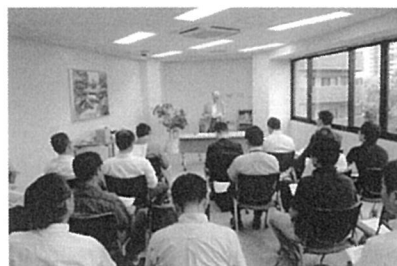
多くの会員が参加した記念講演会